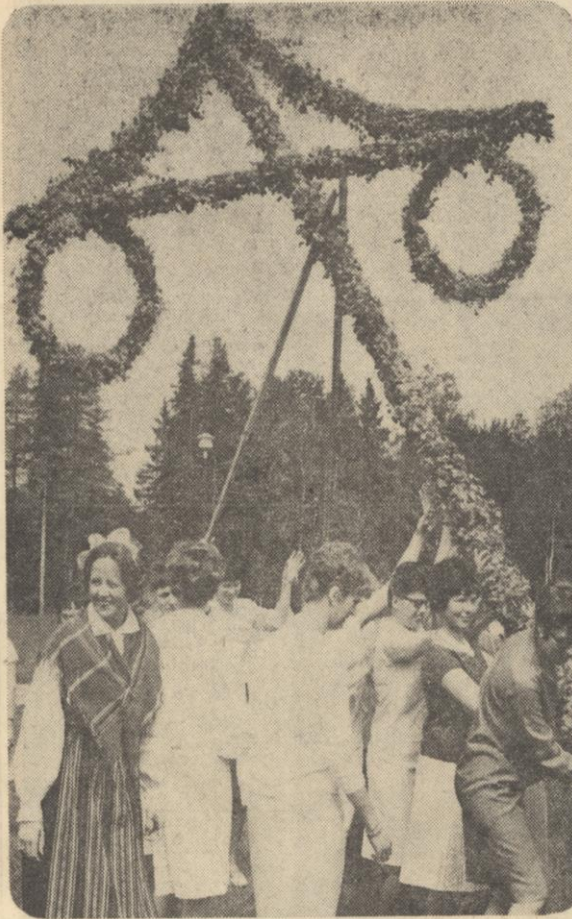
Ah hej äh hä, vilket midsommarschä... Flickorna vid Levar lantshushållsskola reser sin midsommarstång.