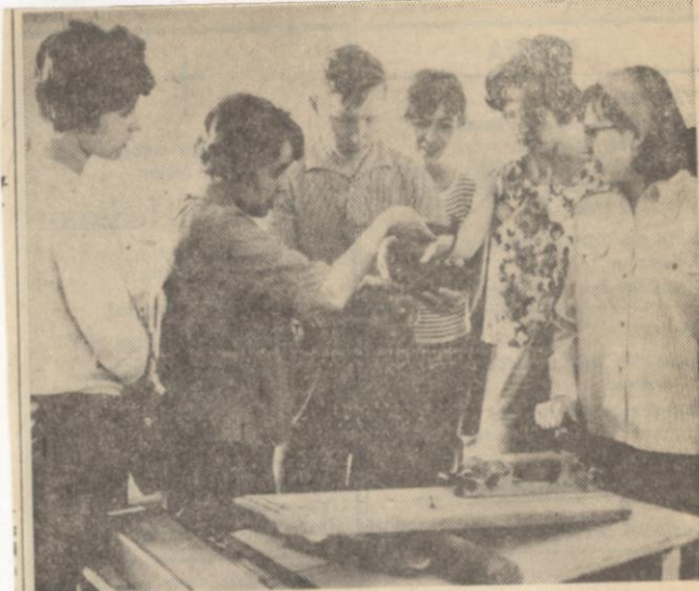
Gamla ting för hem och hushåll intresserade de finska gästerna.