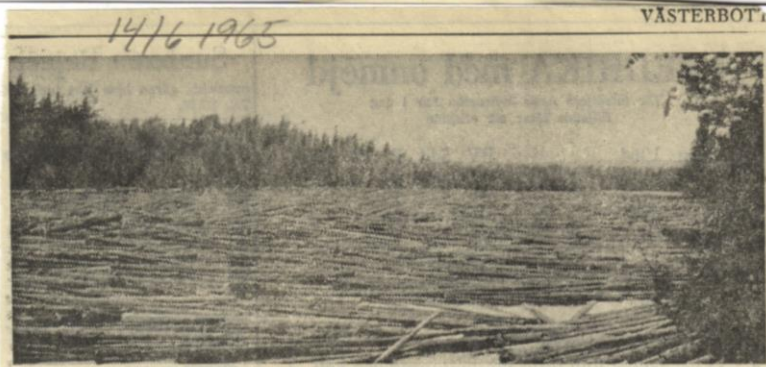
Timmermassorna fyller älven från strand till strand.